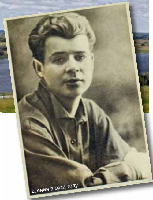
Есенин в 1924 году

веднику С. А. Есенина. Важно, что в последние годы в своей повседневной работе мы ориентируемся на выполнение долгосрочной целевой программы развития музея-заповедника на 2010–2015 годы. В ней в качестве одного из приоритетных направлений указано сохранение целостного уникального природно-ландшафтного комплекса, связанного с жизнью и творчеством С. А. Есенина.