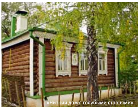
«Низкий дом с голубыми ставнями»

Главная тема последнего на сегодняшний день четвертого выпуска — взаимосвязь культурно-экологических проблем. Сохранение природно-исторических ландшафтов музеев-заповедников требует целенаправленных усилий и музейных сотрудников, и властных структур. В сборнике приводится опыт нескольких крупных музейных комплексов страны. Особое внимание уделено музею-запо-